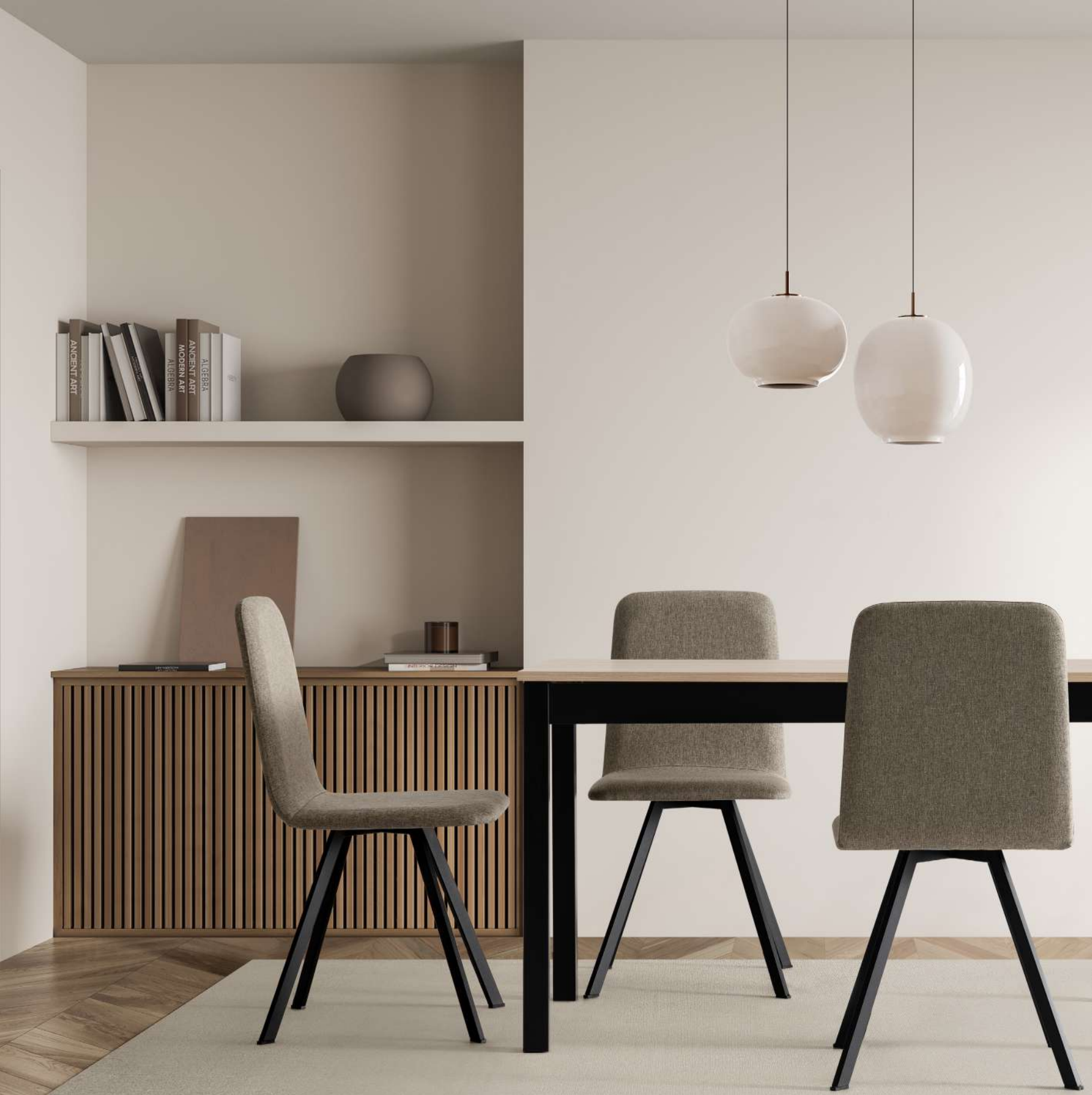
Silla Marta. Chasis Negro / Romer Piedra Mesa Indi. Chasis Negro / Tapa Olmo 100x60 - 344 / 110x70 - 375 / 120x80 - 401